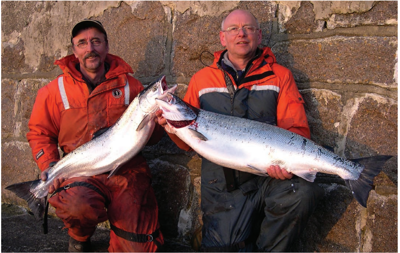
Drivgarnsfiskeriet i Østersøen stoppes i 2008 og det vil få indflydelse på laksebestanden.

– endelig stoppes drivgarnene, men det er ikke nok